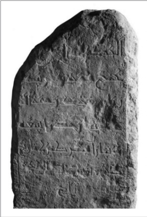
Рис. 1. Эпиграфический памятник раннего периода (XVII в.)

ней(земле) смертны», нередко с продолжением «و يبقى وجه ربك ذو الجلال و الاكرام» — «И вечен лишь лик Господа твоего, который преисполнен величия и щедрости». Крайне важно концептуальное ядро многих эпитафий — аят «انا لله و انا اليه راجعون» «Поистине Мы принадлежим Аллаху и поистине к Нему наше возвращение», который, как справедливо отмечал Ш. Марджани, формулирует суть исламского отношения к смерти как к возвращению, а не конечной гибели 9 . Эта часть текста выполняла функцию духовного наставления для каждого посетителя кладбища, визуально закрепляя в камне идеи, изложенные в пророческом хадисе: посещение могил «удерживает от наслаждений жизни ближней и напоминает о жизни