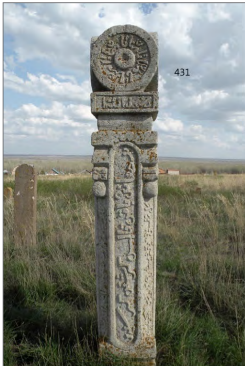
Рис. 4. Татарские эпитафические памятники Западного Приуралья.

(профессиональные) памятники. Их отличает тщательная шлифовка камня-плитняка, сложная резная орнаментика (часто растительный или геометрический плетеный узор), обрамляющая текст, и виртуозная каллиграфия (Рис. 4). Логично предположить существование специализированных мастерских с разделением труда: подмастерья занимались черновой обработкой плиты и нанесением контуров орнамента, а мастер-каллиграф (хаттат) выполнял тончайшую работу по резке текста. Ко второму уровню относятся кустарные (локальные) памятники. Их изготовление отличалось большей простотой, иногда небрежностью в обработке поверхности, упрощенной графикой букв. Вероятно, такие камни создавались местными грамотными жителями, владевшими навыками резьбы, для нужд своей или соседней деревни, что указывает на широкую распространенность эпитафической грамотности в среде.