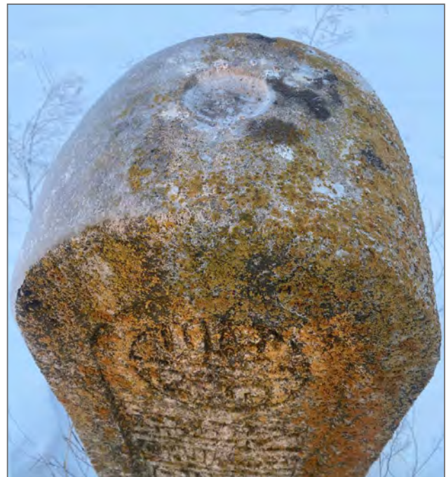
Рис. 5. Надгробие с утилитарно-благотворительной функцией - «непрекращающейся милостыни».

Таким образом, в результате проведенного исследования была разработана комплексная классификация эпитафических памятников Западно-