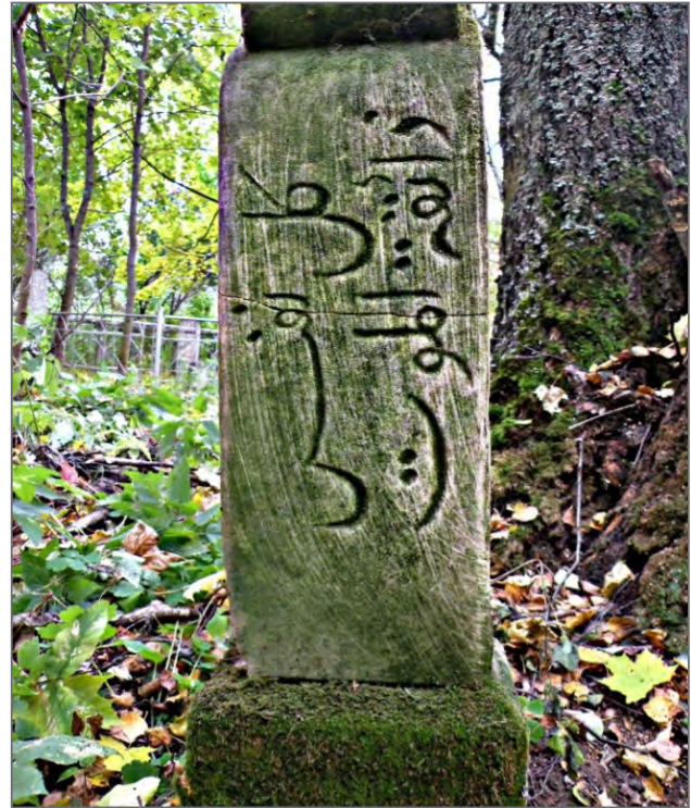
Рис. 2. Эпиграфический памятник с надписью сверху вниз «كل نفس ذائقة الموت» («каждая душа вкусит смерть») будущей 10 .

Следующий блок носит молитвенно-просительный характер и представляет собой прямую инвокацию, обращенную к Аллаху. Канонической формулой является фраза «يا الله ارحم عبدك» — («О Господи! Прояви милость к рабу твоему», за которой часто следует имя усопшего. Вплетение в эпитафию такой мольбы глубоко мотивировано исламским вероучением. Поскольку, согласно преданию, с прекращением земной жизни для человека обрывается и возможность совершать благие дела, кроме трех (среди которых — праведные дети, творящие за него молитву), ключевую роль начинает играть дуа (мольба) живых. Таким образом, надпись выступает инструментом посмертного «заочного» дуа, побуждая любого грамотного посетителя, прочитавшего текст, стать «благодетелем» для покойного. Эту же функцию несет и ставшее обязательным для татарской эпитафии слово «مرحوم» (Рис.3). Его семантика, восходящая к арабскому глаголу